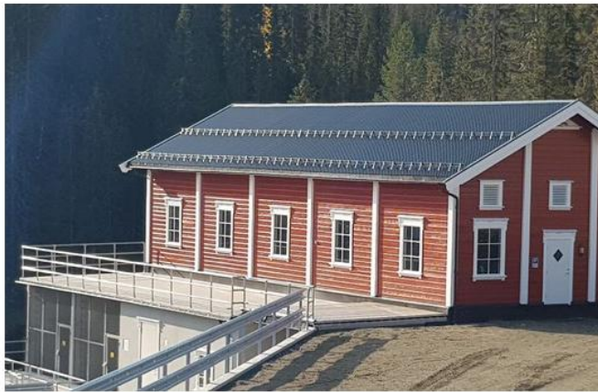
Søkkunda kraftverk ble satt i drift i 2017. Det har en midlere årsproduksjon på 25 GWh.