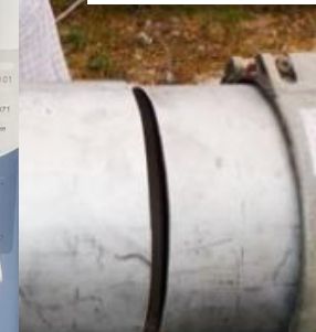
Her fra mikrokraftverket